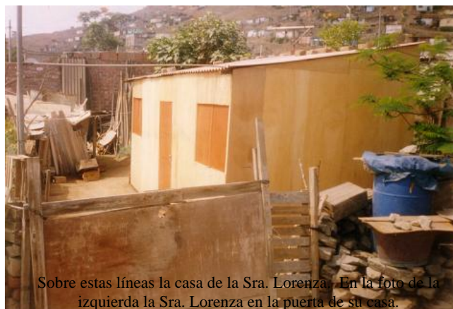
Sobre estas líneas la casa de la Sra. Lorenza. En la foto de la izquierda la Sra. Lorenza en la puerta de su casa.